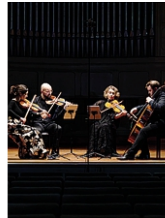
Il Quartetto Nous in Sala Piatti