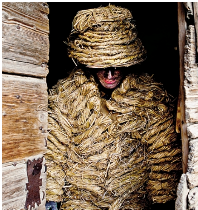
La foto che introduce la mostra «AlpiMagia» di Stefano Torriero

Il progetto di Stefano Torriero ripercorre le tappe di un anno solare nelle Alpi, documen-