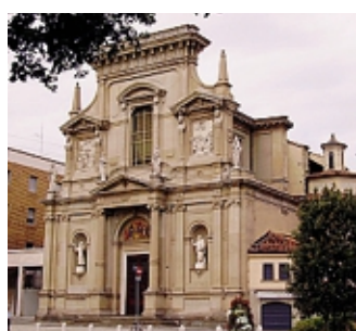
La chiesa che ospita il concerto

Si tratta di un florilegio della Letteratura Corale Alpina classica e d'autore, animata da quattro Cori Ana della nostra