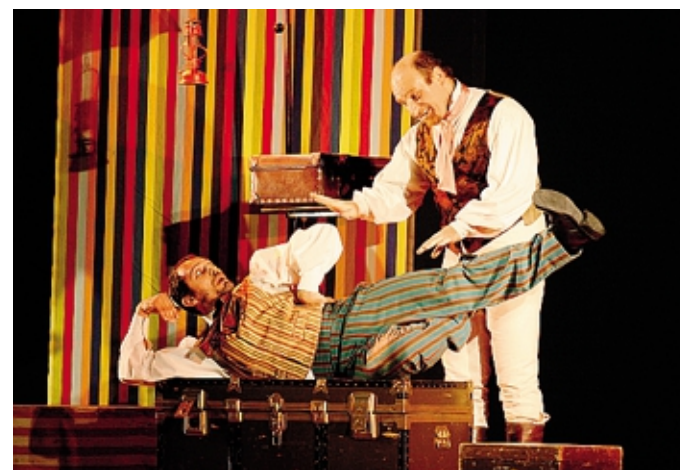
Nespoli e Tartufo nella «Fiaba dei tre bauli» in scena ad Ambivere

Gli spettacoli sono a pagamento e i posti limitati. Si consiglia la prenotazione al 3208626995.