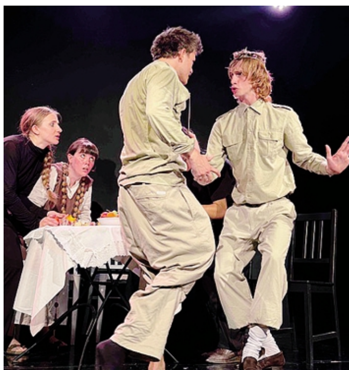
Una foto di scena del «Macbett» di Ionesco per la regia di Mancini

Lo spettacolo, che mantiene lo stesso titolo, sarà rappresentato stasera alle 20,30 a Pontirolo Nuovo nella sala Arhat teatro (via San Michele, 1) e aprirà «Gemme... di teatro», rassegna teatrale che continuerà fino a giugno, organizzata dalla compagnia bergamasca di teatrodanza Arhat teatro e patrocinata dall'amministrazione comunale. Questo «Macbett» ha già avuto riscontri positivi in festival e teatri in Italia e in Francia ed è il primo spettacolo di Tan Tan Teatro, gruppo teatrale universitario studentesco nato a Torino nel 2024 come esperienza di incontro e di sviluppo di progetti artistici, guidato dal regista Leonardo Mancini, anche docente associato all'Università di Torino (dove insegna Storia del Teatro) e membro del team editoriale della pubblicazione annuale specialistica internazionale JTA - Journal of theatre an-