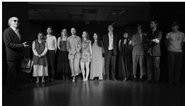
Due monneti degli spettacoli messi in scena da «Arhat Teatro»

Il pomeriggio seguente, invece, nella medesima location è stata la volta di «Fiori», uno studio/rapso-dia drammatica ispirato ai «Fleurs du mal» di Charles Baudelaire e realizzato direttamente dal collettivo di «Arhat teatro». Non solo: